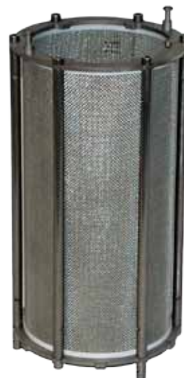
Waschtrommel Washing drum

One of the most essential points of innovation and further development is the again reduced solvent loss per extraction. The value calculated according our internal quality criteria was stated for earlier supplied machines with < 50 ml. For the new Asphaltanalysator this important value can be stated with < 20 ml allowing us to award the machine with the infraTest ecological seal of approval ecoTest.