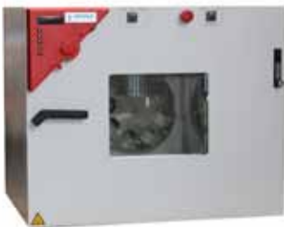
20-2572 Dünnsfilm-Prüfofen RTFOT Rolling Thin Film Oven RTFOT